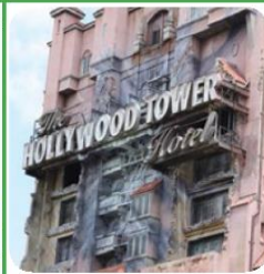
DISNEY WORLD MGM STUDIOS