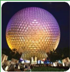
DISNEY WORLD EPCOT CENTER