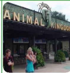
DISNEY WORLD ANIMAL KINGDOM