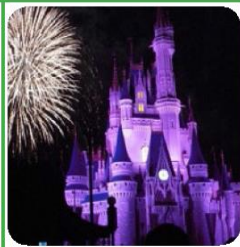
DISNEY WORLD MAGIC KINGDOM