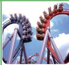
ISLAND OF ADVENTURE