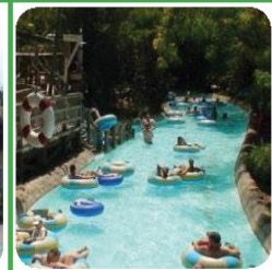
DISNEY WORLD TYPHOON LAGOON