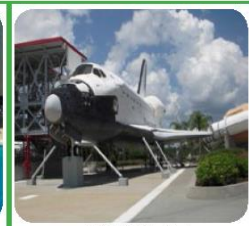
JFK SPACE CENTER