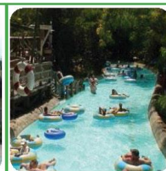
DISNEY WORLD TYPHOON LAGOON