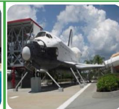
JFK SPACE CENTER