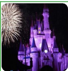
DISNEY WORLD MAGIC KINGDOM