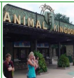
DISNEY WORLD ANIMAL KINGDOM