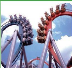
ISLAND OF ADVENTURE