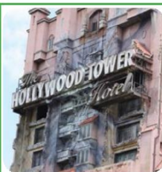
DISNEY WORLD MGM STUDIOS