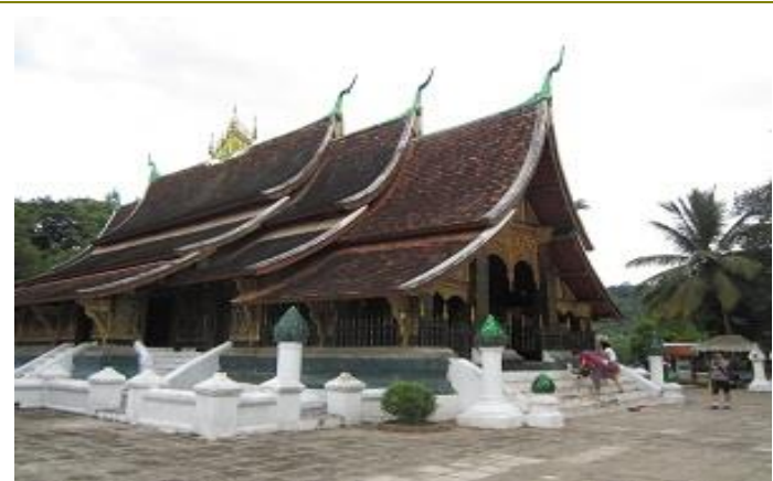
วัดเชียงทอง