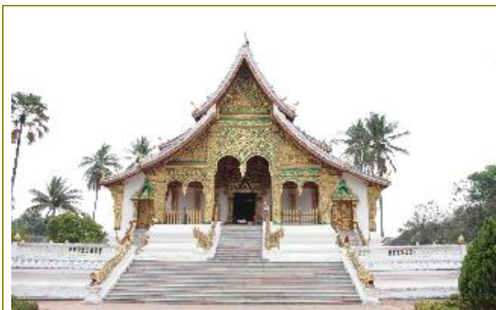
พระราชวัง และ หอพิพิธภัณฑ์หลวงพระบาง