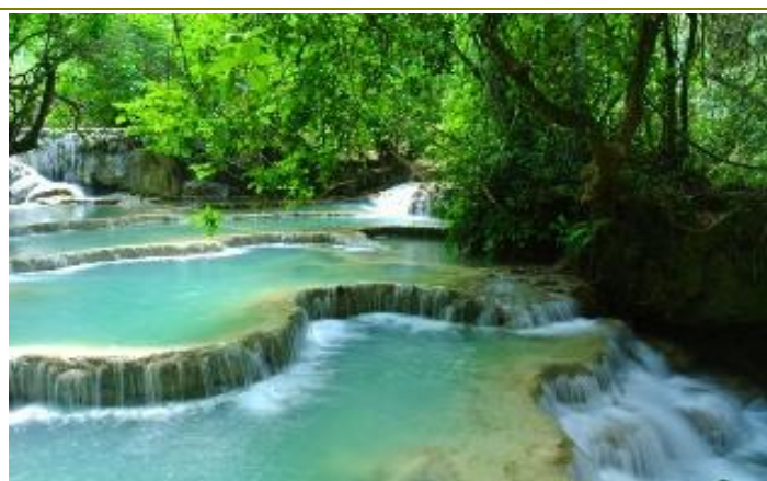
น้ำตกกวางสี