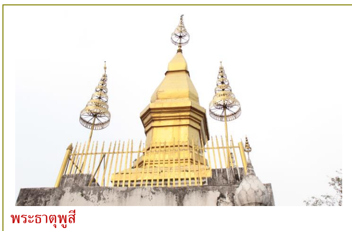
พระธาตุพูสี