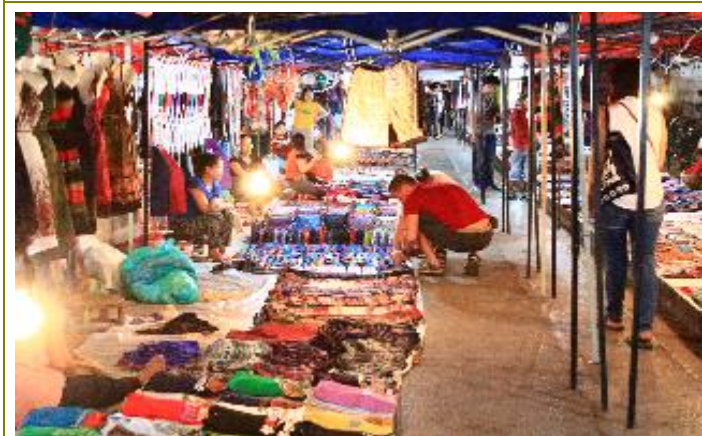
บรรยากาศตลาดกลางคืน