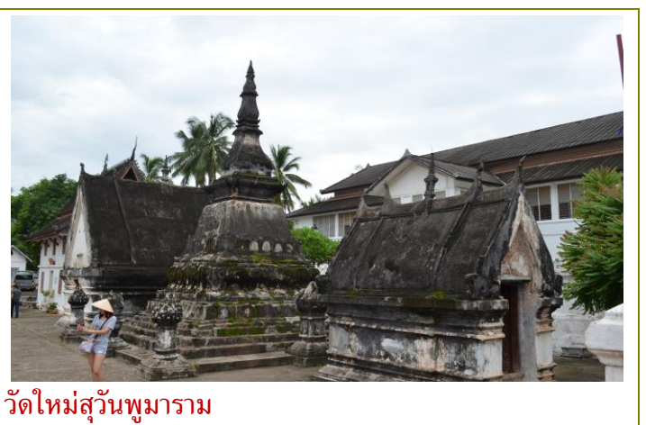
วัดใหม่สุวรรณพุมาราม