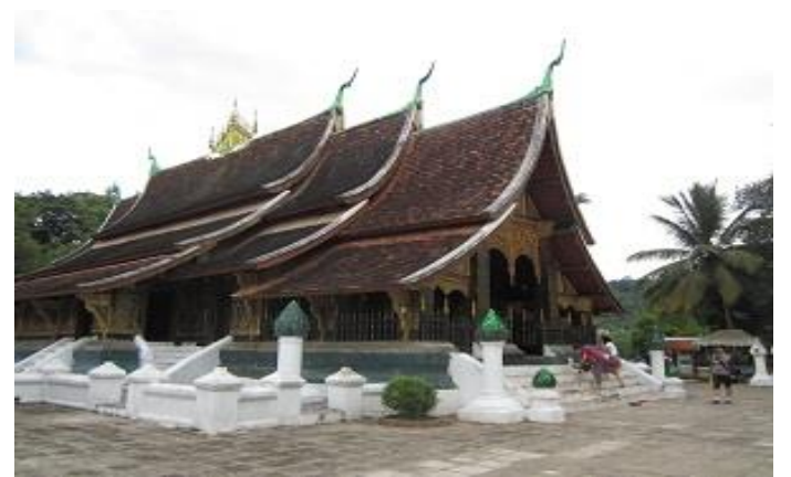
วัดเชียงทอง