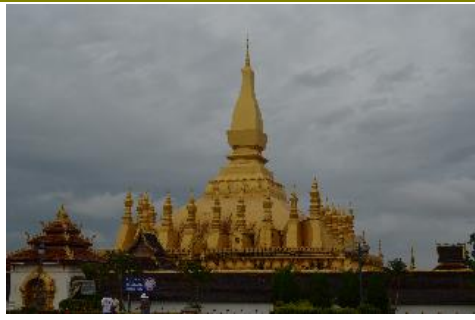
วัดพระธาตุหลวง