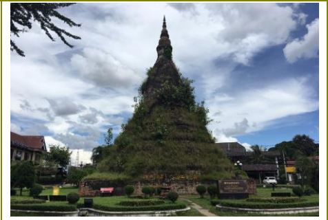
พระธาตุตา