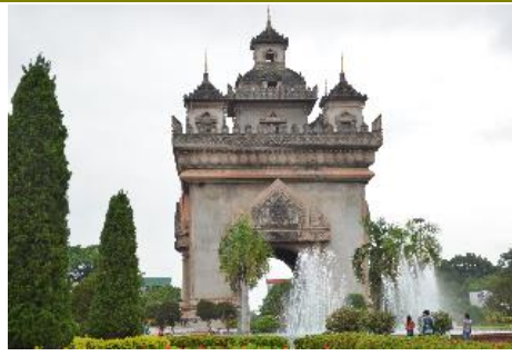
ประตูชัย