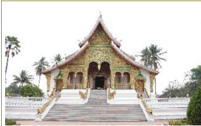
พระราชวัง และ หอพิพิธภัณฑ์หลวงพระบาง