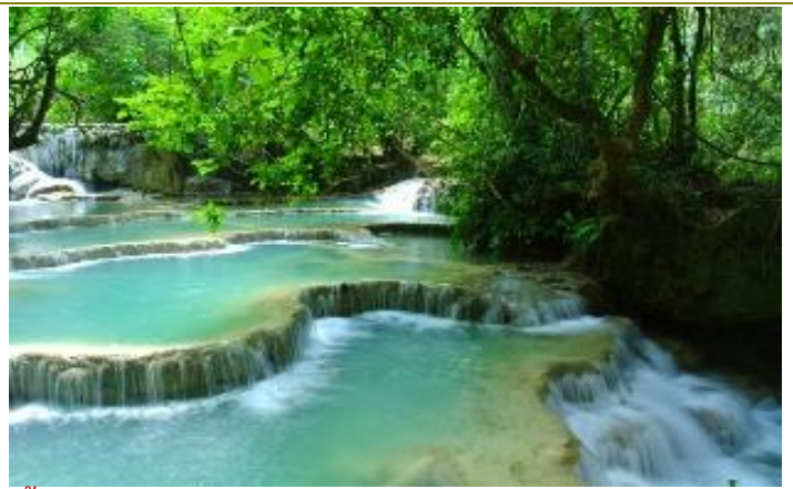
น้ำตกกวางสี