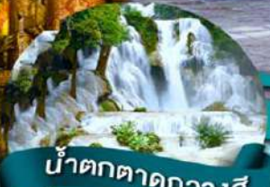
น้ำตกตาดหลวงสี