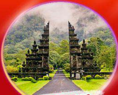
ประตูฮันดารา