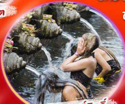
บ่อน้ำพุศักดิ์สิทธิ์ Tirta Empul